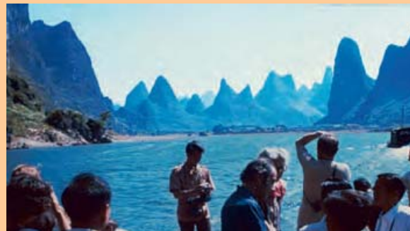
Guilin – Li-Fluss

Vormittags Flug Xian–Guilin. Nachmittag kleiner Stadtrundgang durch die Stadt mit subtropischem Klima.