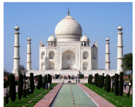
Agra : Taj Mahal

Preis-, Kurs- und Bestimmungsänderungen bleiben vorbehalten.