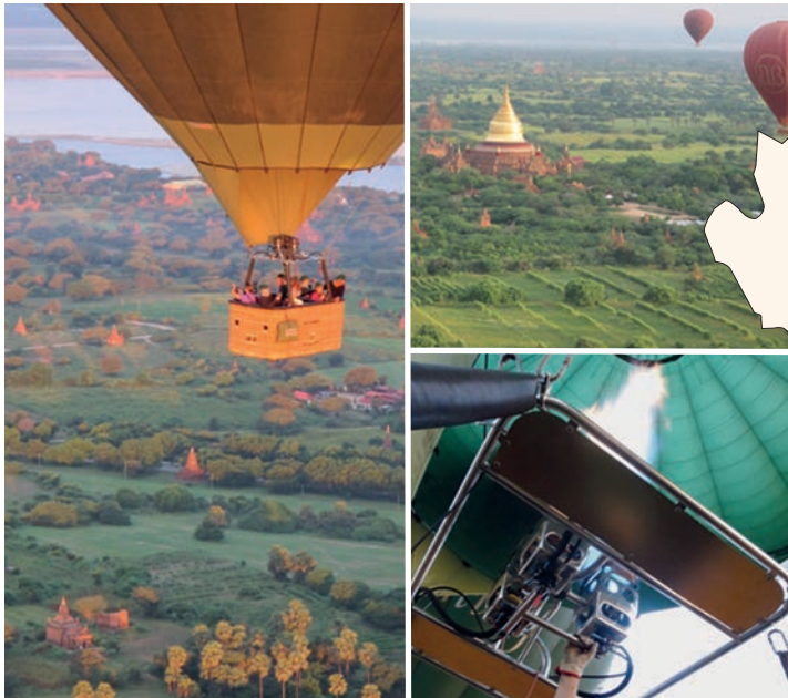
Ballonfahrten, Bagan – Ein einmaliges Erlebnis

Ein Land in dem die Zeit scheint stehen geblieben zu sein. Einzigartige kulturelle Schätze, eine liebenswerte Bevölkerung und unvergleichliche Landschaftsbilder prägen die tiefen Erlebnisse, die jeden Besucher zu faszinieren vermögen.