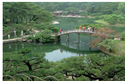
Ritsurin Bonsai-Garten, Takamatsu Unten: Itsukushima-Schrein, Miyajima