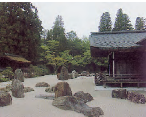
Mt. Koya, Kongobuchi-Tempel