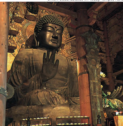
Unten: BuddhaStatue im Todaiji-Tempel, Nara