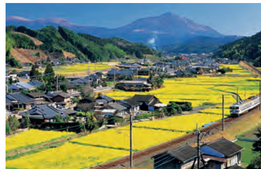
Typisch japanische Landschaft

Tor zu schwimmen und bildet mit dem roten Balkenwerk einen überaus malerischen Anblick. Nachmittags Fahrt mit dem Shinkansen-Superexpress-Schnellzug bis Osaka und von dort mit einem Lokalzug bis zum Mt. Koya. Im Laufe des Nachmittags Ankunft auf dem Klosterberg und Gelegenheit, den Kongobuchi-Tempel sowie die Grabstätten von Kobo Daishi zu sehen. Der Koya-Berg ist berühmt als Zentrum der buddhistischen Shingon-Sekte, deren Tradition bis auf das Jahr 816 zurückgeht. Auf den abgeflachten Gipfeln befinden sich heute 154 Tempel. Wir werden in einem dieser Tempel übernachten und ein vegetarisches Abendessen einnehmen.