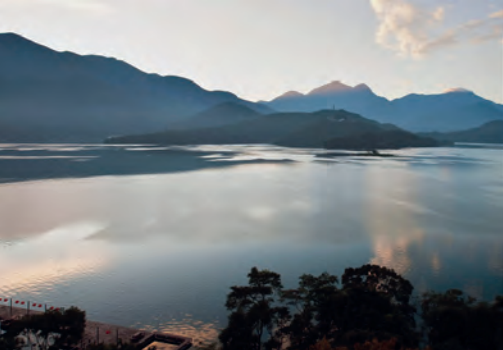
Sun Moon Lake