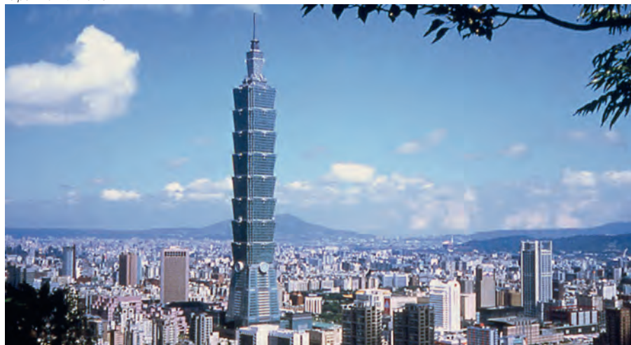
Taipei mit "101-Tower"

Fahrt südlich Richtung nach Tainan. Besuch des Chikan Tower, des Confucius Tempels sowie des Fort Anping. Anschliessend Weiterfahrt zum Foguangshan Kloster, dem grössten buddhistischen Kloster von ganz Taiwan. Übernachtung in einem Guest House des Klosters.