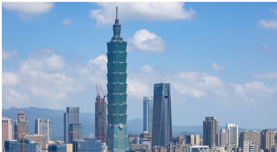
Taipei mit "101-Tower"

Fahrt südlich Richtung nach Tainan. Besuch des Chikan Tower, des Confucius Tempels sowie des Fort Anping. Anschliessend Weiterfahrt zum Foguangshan Kloster, dem grössten buddhistischen Kloster von ganz Taiwan. Übernachtung in einem Guest House des Klosters.mmm