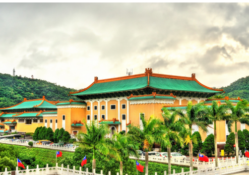
Das Nationale Palastmuseum