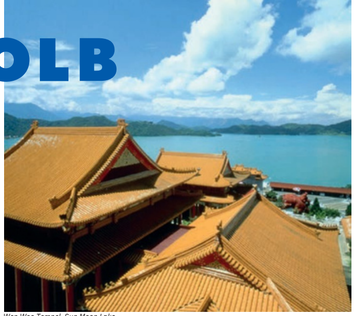
Wen Woo Tempel, Sun Moon Lake