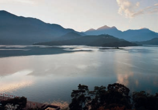
Sun Moon Lake