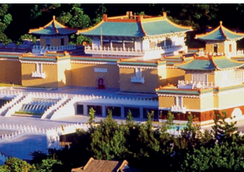
Das Nationale Palastmuseum