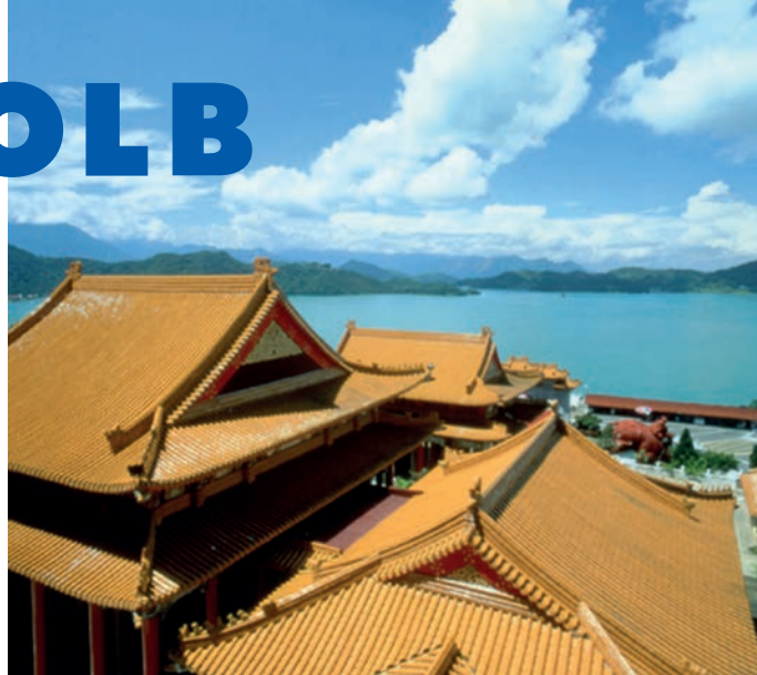
Wen Woo Tempel, Sun Moon Lake