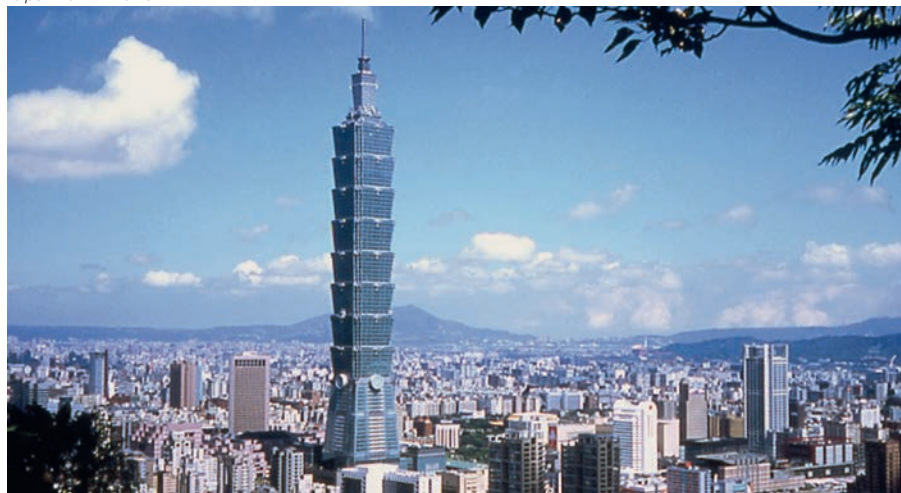
Taipei mit "101-Tower"

Fahrt südlich Richtung nach Tainan. Besuch des Chikan Tower, des Confucius Tempels sowie des Fort Anping. Anschliessend Weiterfahrt zum Folangshan Kloster, dem grössten buddhistischen Kloster von ganz Taiwan. Übernachtung in einem Guest House des Klosters.