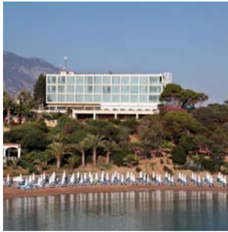
Hotel Denizkizi *** Kyrenia

Lage: in einer wunderschönen Bucht mit privatem, kleinen Sandstrand, ca. 10km ausserhalb der Stadt Kyrenia/Girne und ca. 45km vom Flughafen Ercan entfernt.