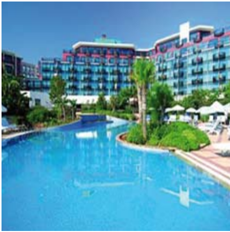
Merit Crystal Cove **** Kyrenia