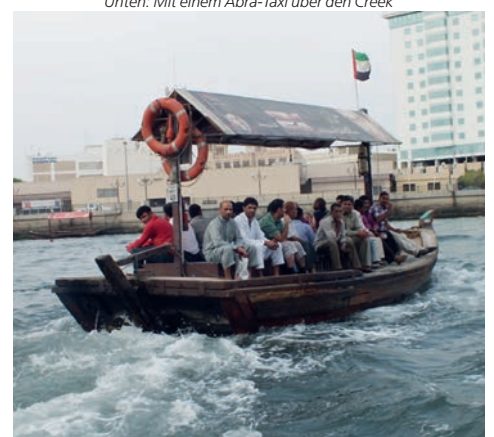
Unten: Mit einem Abra-Taxi über den Creek