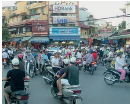
Der ganz normale Verkehrswahnsinn

Fahrt nach Danang und Besuch des Cham Museums sowie der beeindruckenden Marmor-Berge.