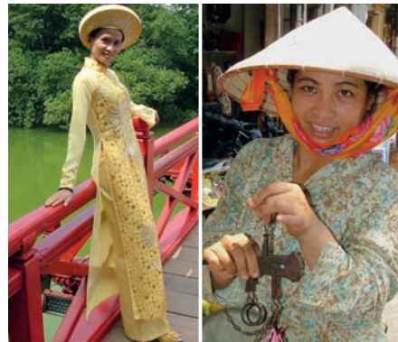
Schönheiten in Hanoi