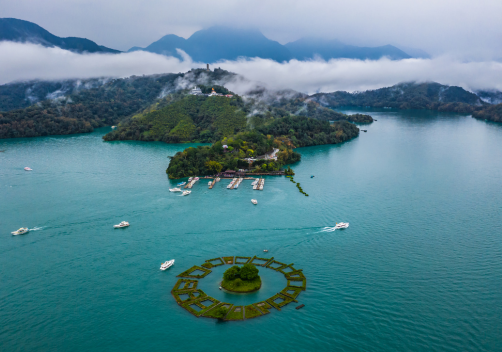
Sun Moon Lake