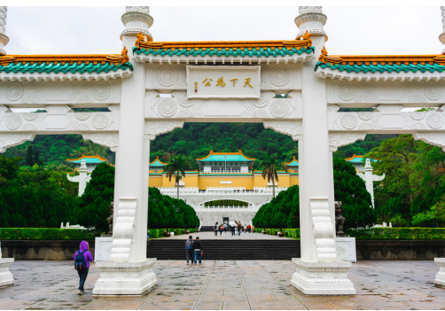
Das Nationale Palastmuseum