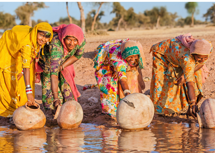
Frauen aus Rajasthan