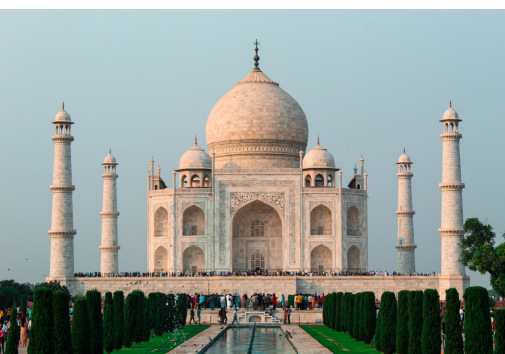
Taj Mahal, Agra