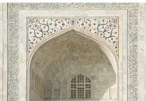
Unten: Herrliche Prachtbauten