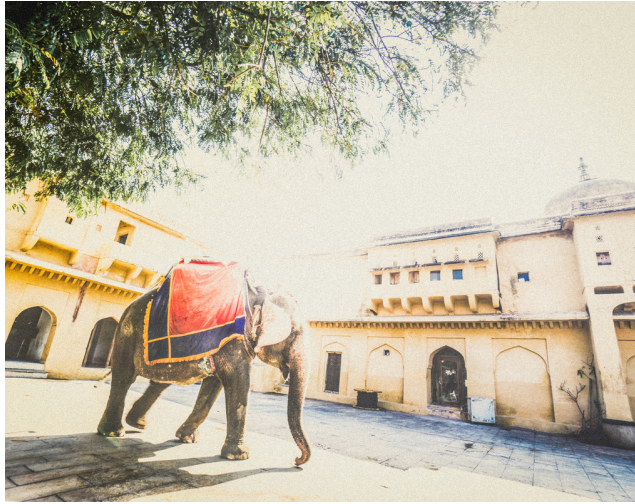
Elefanten zum Fort Amber

Mumbai – Udaipur – Jodhpur – Jaipur – Agra – Delhi