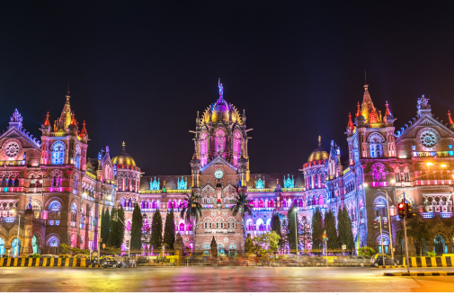
Chhatrapati Shivaji Terminus (Hauptbahnhof)