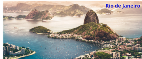
Rio de Janeiro

Vormittag Rückfahrt nach Manaus. Nachmittag Besuch der wichtigsten Sehenswürdigkeiten wie z.B. das Amazonas-Opernhaus aus dem Jahre 1896, sowie das Indian-Museum mit den mehr als 3000 Gegenständen, welche die Geschichte und die Kultur der Ureinwohner erklären.