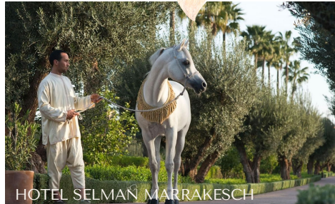
HOTEL SELMAN MARRAKESCH