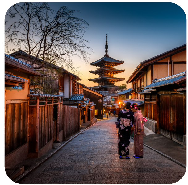
Kiyomizu-dera Tempel, Kyoto, Wiege der japanischen Kultur