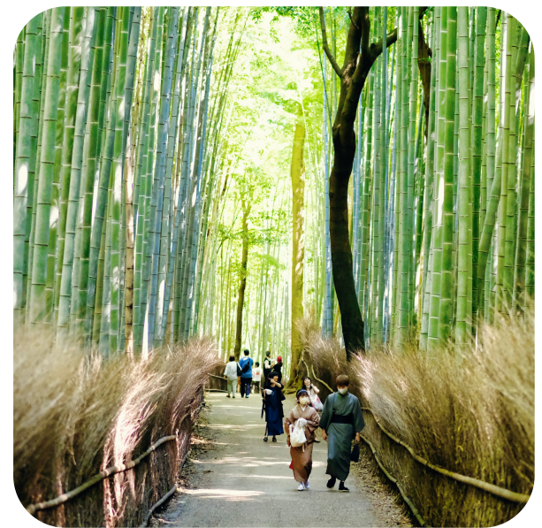
Bambuswald in Kyoto