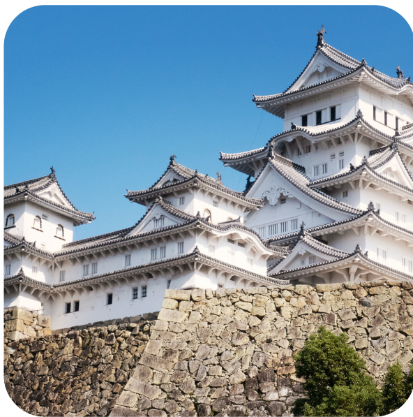
"Himeji Schloss", das wohl berühmteste Schloss in Japan